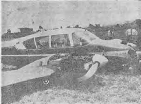
GRACILES LINEAS ABOLLADAS. El aparato quedó así plantado en media pista. Los daños son —aunque no se notan— bastante serios: hélices dobladas, con posible daño del "crank shaft", y deterioros considerables en la parte inferior del fuselaje.