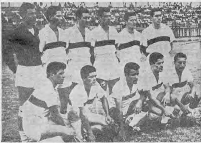
En la capital y a las diez en punto de la mañana, jugarán mañana el Cartaginés y el Uruguay de Coronado. En la actualidad los brumosos tienen una pérdida en sus presentaciones, mientras que los uruguayos están en el sótano sin puntaje. Por tratarse de un duelo en la capital creemos que llevará mucha concurrencia, y la provincia de Cartago con sus miles de fanáticos se trasladará para alentar a sus pupilos, que mucha falta les hace. El preliminar lo jugarán las reservas de ambos clubes.