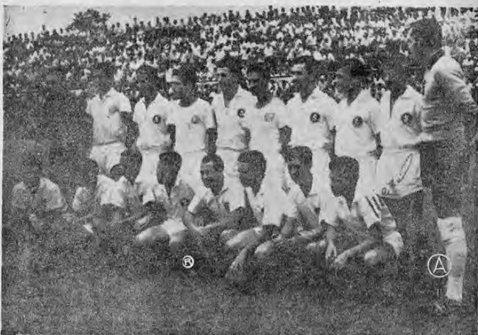
La próxima salida de un equipo nacional al extranjero será el 17 de junio y en esta ocasión será el Deportivo Saprissa quien jugará en Honduras contra el Olimpia, en la celebración del cincuentario de esa entidad catracha. Los morados no han solicitado permiso a la Federfútbol aún, aunque la Liga Superior lo tiene en conocimiento.