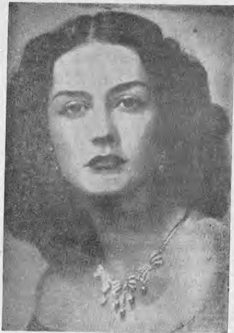
Señora doña ANA FRANGO DE FACIO