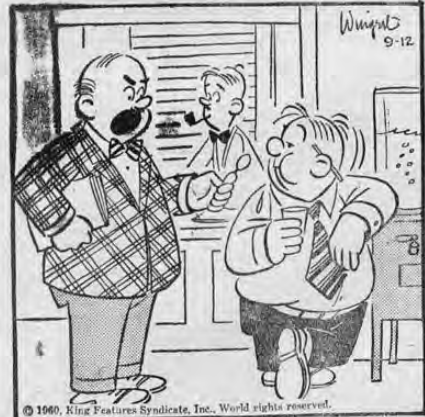
Usted y el botellón de agua serán próximamente transridos.